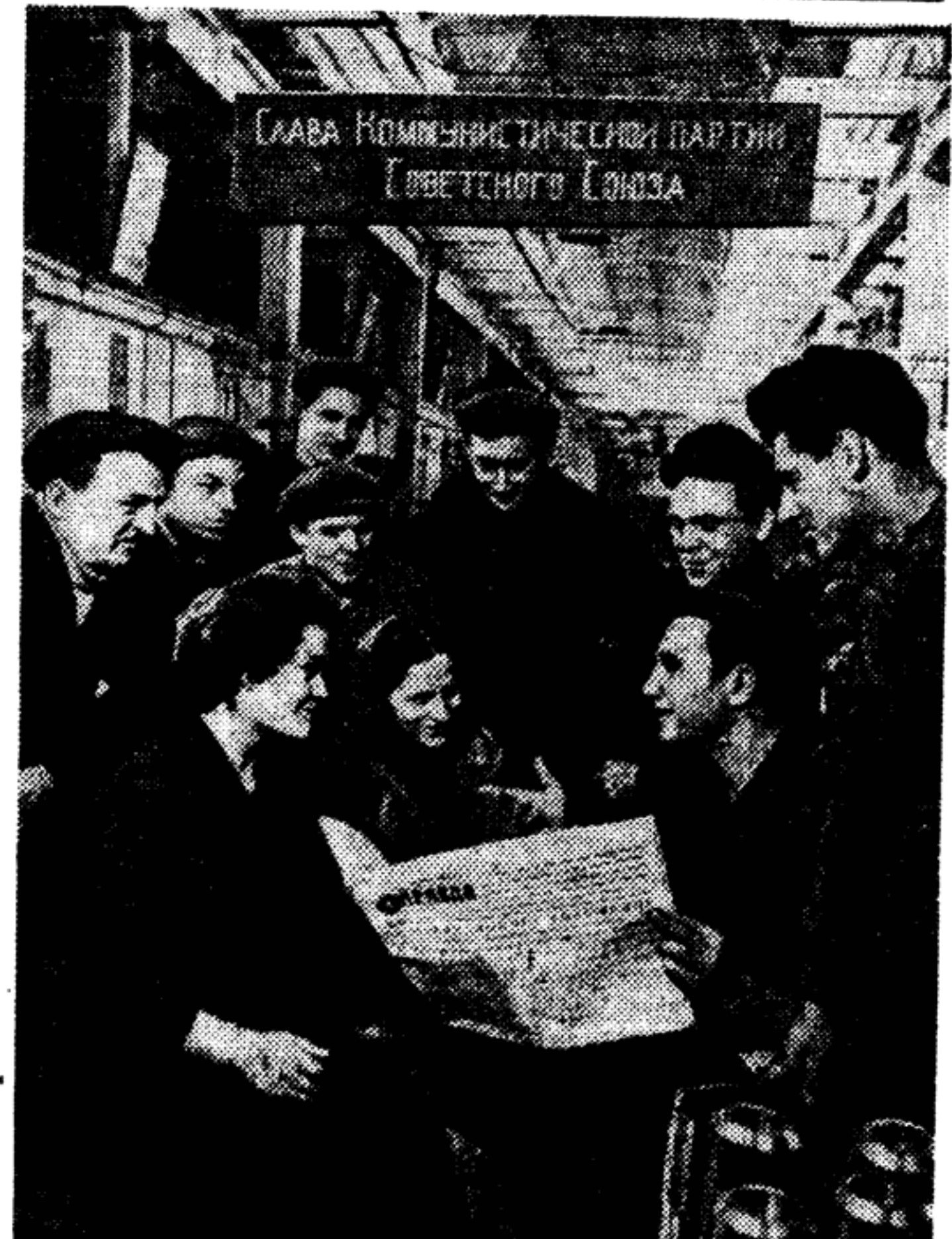
С большим энтузиазмом встретили трудящиеся столицы опубликованные в печати тезисы доклада Н. С. Хрущева на XXI съезде КПСС. На снимке: рабочие механического цеха Московского инструментального завода «Калибр» знакомятся с тезисами.

Ярок, негасим свет ленинских идей, свет коммунизма. Хочется работать и работать, дышать полной грудью, чувствовать святую потребность отаить всего себя партии — вот мое сердце, вот мое перо, — они должны служить коммунизму.